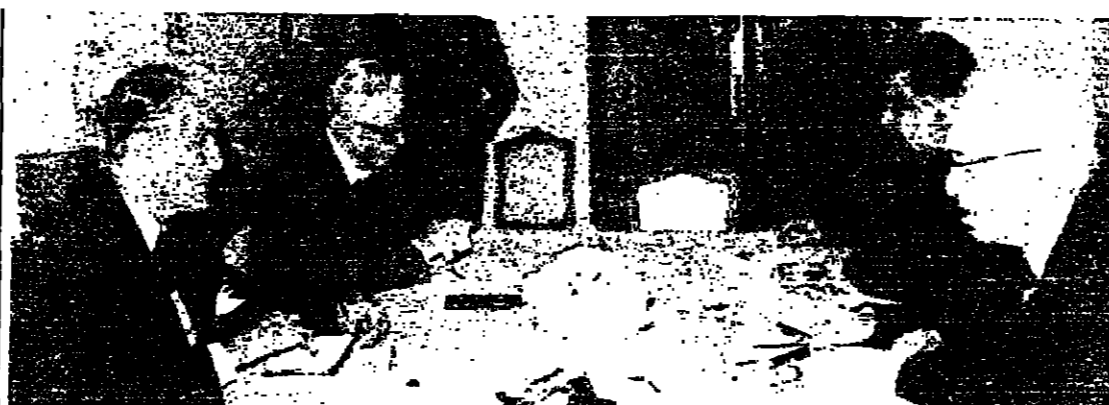
الاجتماع في اجتماع امس